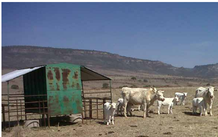
Figura3. Comedero de alimentación restringida (Creep Feeder), Rancho El Jaguey, Monte Escobedo, Zac.