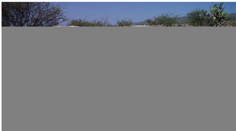
Figura 5. Semental usado en empadres controlados, Monte Escobedo, Zacatecas.

sistema de suplementación y complementación adecuados, los animales entrarán en celos naturales cuando incrementen su condición corporal, que generalmente es en época de lluvias, por lo que el establecimiento del empadre se realizará en éstas fechas, con la consecuencia de parir en épocas secas. El empadre controlado se establece por lo general durante 4 meses del año, donde se espera que el 50% de las vacas queden cargadas en el primer mes, el 70% en el segundo y el resto distribuido en los últimos dos meses.