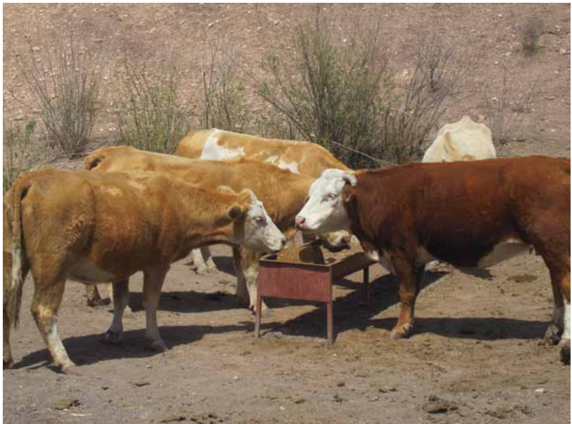
Figura 2. Suplementación con bloques nutricionales y con alimento a granel, Durango.

Los BMN no sustituyen a la materia seca necesaria por los rumiantes, por lo tanto la principal fuente de alimento para el ganado debe ser el agostadero por lo que es imprescindible un buen manejo de los pastizales.