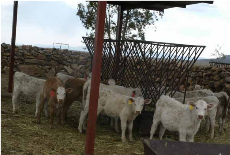
Figura 4. Becerros sometidos a destete precoz, Monte Escobedo, Zacatecas.