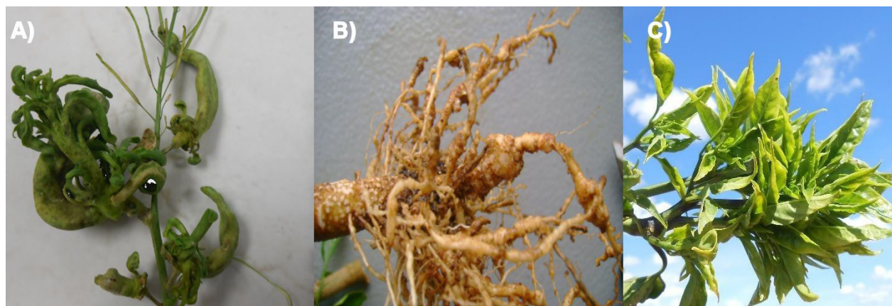
Figura 3. Morfología de plantas causada por patógenos como A) vainas modificadas en plantas de Sisymbrium irio B) agallas inducidas por Agrobacterium spp y C) escoba de bruja causada por fitoplasmas en plantas de Capsicum annuum . Figure 3. Plant morphology caused by pathogens, such as: A) modified sheaths in Sisymbrium irio plants; B) galls caused by Agrobacterium spp.; and C) witch's broom caused by phytoplasmas in Capsicum annuum plants.

directos de las fuerzas evolutivas que impulsan la coevolución entre el hospedero y el patógeno (McCann y Guttman, 2008). Los alelos de los efectores que aumentan el éxito reproductivo del patógeno, serán inmediatamente favorecidos por la selección natural. La selección direccional o selección positiva, es un tipo de selección natural que favorece a un solo alelo y por esto la frecuencia alélica de una población continuamente va en una dirección, dado que este mecanismo también puede conducir a adaptaciones (Futuyma, 2013).