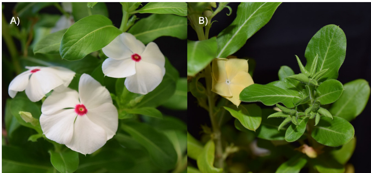
Figura 1. Estructuras florales sanas de Catharanthus roseus (A), con filodia y virescencia causada por Candidatus Phytoplasma trifolii (B).

Biotrophic fungi and oomycetes have developed haustoria to manage effector proteins within the host cell (Whisson et al. , 2007). Phytoparasitic nematodes use a specialized feeding organ known as a stylet to inject their effector proteins into a parasitized vascular cell (Davis et al. , 2008).