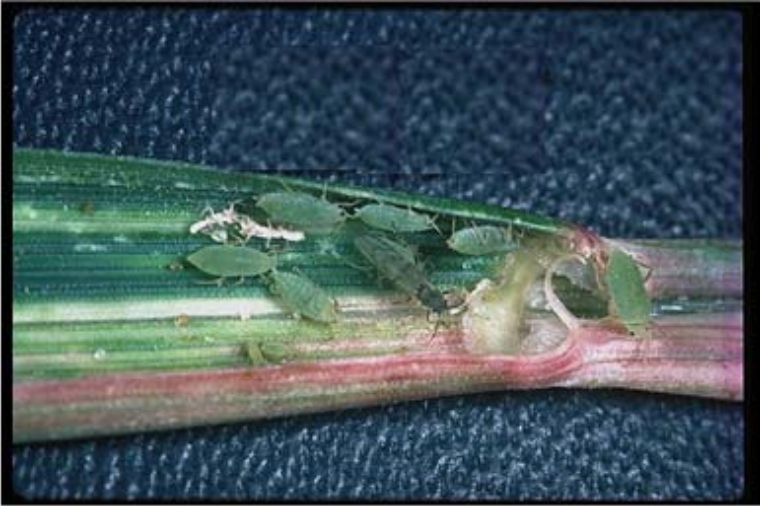
Figura 19. Pulgón ruso ( Diuraphis noxia ) ( Mordvilho) de la cebada.