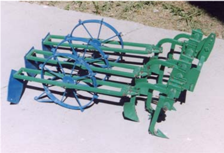
Figura 8. Cultivadora - pileteadora para dos surcos a 76 centímetros de separación.

Al quedar los surcos a 76 centímetros y piletas cada 2.4 metros, es posible captar el agua de las lluvias del temporal (Figura 9), similar al sistema de siembra en surcos doble hilera, señalado anteriormente. Con el sistema de corrugaciones con pileteo, las plántulas de cebada emergen tanto en el fondo, en la falda, como en el lomo del surco.