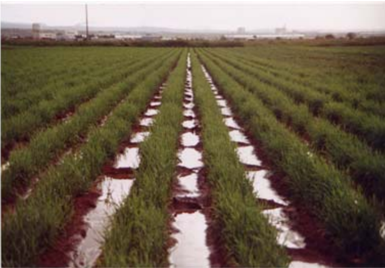
Figura 7. Captación del agua de lluvia con la siembra en surcos doble hilera con pileteo.

Para implementar este método de siembra en surcos a doble hilera con pileteo, se requiere acondicionar o comprar una máquina de dos o cuatro surcos; ésta se puede adaptar con dos botes fertilizadores de cuatro salidas cada bote; uno de ellos se usa para el fertilizante y el otro para distribuir la semilla (Figuras 6 y 7).