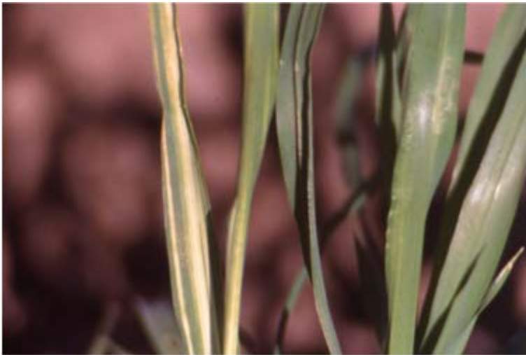
Figura 20. Síntomas del daño causado por pulgón ruso en cebada maltera.