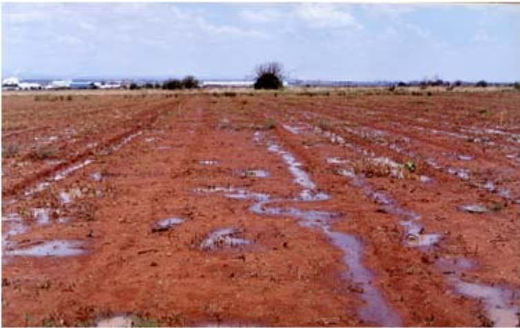
Figura 4. Siembra tradicional al voleo.

Otros productores usan la sembradora fertilizadora de cereales; en ambos métodos, el terreno queda en plano después de la siembra cuando se presenta la primera lluvia del temporal; la mayor parte del agua se infiltra porque el suelo estaba suelto, pero después de ésta el suelo se seca y forma una capa dura, debido principalmente a la falta de materia orgánica; consecuentemente, al presentarse las siguientes lluvias hay poca infiltración y la mayor parte del agua se pierde por escurrimiento, debido a la poca infiltración al suelo y sobre todo, por que no existen depresiones sobre el suelo que capten y retengan el agua (Figura 4).