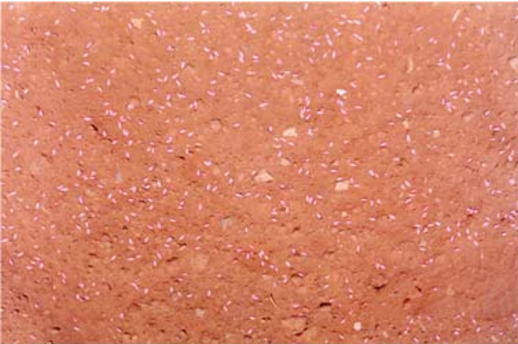
Figura 3. Distribución de la semilla de cebada al voleo.