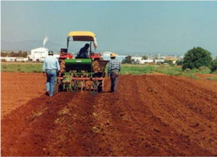
Figura 15. Calibración de semilla e inicio de la siembra en surcos a doble hilera con pileteco.

Calibración de la sembradora-fertilizadora de cereales. Si se utiliza la sembradora de cereales, hay que verificar si el engrane superior es grande y el inferior es chico, (hay que tomar la lectura del engrane superior). Por el contrario, si el engrane mayor está en la posición inferior, entonces hay que tomar la lectura inferior y colocar la palanca de abertura de salida de semilla, según la tabla de calibración que aparece en este implemento. Si la lectura da libras por acre pero se quiere usar una densidad de 100 kilogramos por hectárea, entonces se debe colocar la palanca en la letra o número que indique 100 libras por acre, porque un acre es casi media hectárea y una libra es casi medio kilo.