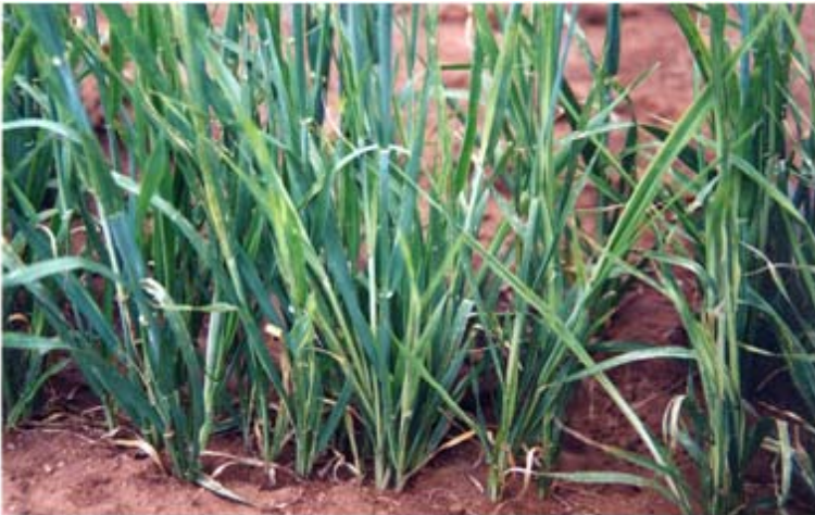
Figura 22. Achaparramiento de los cereales, enfermedad virosa transmitida por pulgón ruso.

Achaparramiento de los cereales. Es otra enfermedad que está cobrando importancia (Figura 22), la cual es causada por virus y transmitida por pulgones, por lo cual es importante un buen control de estos insectos.