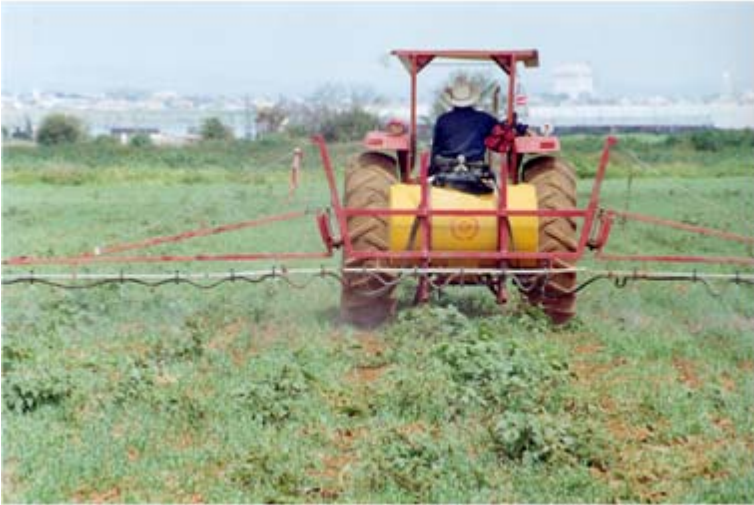
Figura 18. Aplicación mecánica de herbicida para el control de maleza.