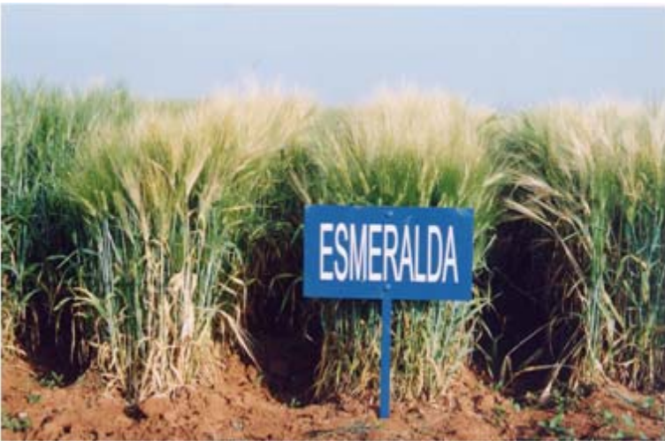
Figura 13. Variedad de cebada maltera Esmeralda.