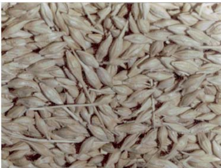
Figura 24. Grano de cebada maltera con 13 porciento de humedad lista para la trilla.

La cosecha de las variedades recomendadas de cebada maltera, para la región de buen potencial se hace entre los 100 y 105 días después de la siembra, mientras que para la región de mediano potencial entre los 90 y 95 días y para la región de bajo potencial entre los 80 y 85 días. El ciclo del cultivo se alarga o se acorta con la mayor o menor precipitación durante el ciclo; este mismo fenómeno ocurre con la fecha de siembra temprana y la fecha tardía, asimismo, con y sin pileteo respectivamente. Para la obtención de forraje, generalmente el corte se realiza entre 10 y 15 días antes de la cosecha del grano, lo cual coincide cuando el grano se encuentra en estado lechoso-masoso.