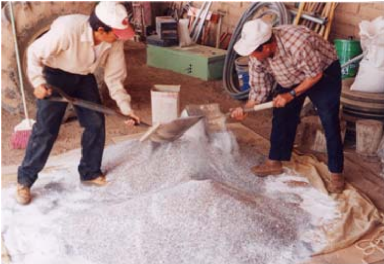
Figura 14. Mezcla de fertilizante de nitrógeno, fósforo y potasio.

(Figura 14 ); con estas dosis las variedades recomendadas manifiestan su alto potencial de rendimiento (Consulte tablas del apéndice de equivalencias en contenido y mezclas de fórmulas de nitrógeno, fósforo y potasio de algunos materiales comerciales, que aparecen al final de esta publicación).