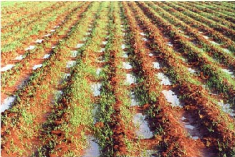
Figura 9. Captación del agua de lluvia con la siembra en corrugaciones con pileteo.

En este sistema de siembra, solamente se requiere la cultivadora y las pileteadoras. Con el pileteo, se capta y retiene el agua de lluvia por más tiempo que la siembra tradicional. La desventaja de este sistema es que solamente se permite la entrada de maquinaria al terreno, hasta la etapa de amacollamiento (ahijamiento) del cultivo; posterior a ésta etapa, el tractor con las llantas pisará y quebrará plantas emergidas en el fondo y lados del surco y no producirán cosecha.