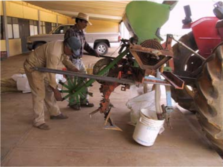
Figura 17. Calibración de la fertilizadora para la siembra en surcos a doble hilera con pileteo.

Calibración de la fertilizadora voleadora. Si para fertilizar se usa el trompo o voleadora, también debe limpiarse antes de su calibración. Se debe medir un área de 10 metros de ancho por 100 metros de largo; en esta superficie de mil metros cuadrados, se debe tirar 25.4 kilogramos de la mezcla compuesta de urea, más superfosfato de calcio triple, más sulfato de potasio, o aplicar 48 kilogramos de la mezcla de urea, más 18-46-00, más sulfato de potasio; también, se pueden aplicar los 21.4 kilogramos de la mezcla de sulfato de amonio, más superfosfato de calcio simple, más sulfato de potasio. Se recomienda también pesar el fertilizante que se va a tirar, y abrir o cerrar la salida cuantas veces sea necesario, hasta obtener la cantidad de fertilizante requerida para esa superficie.