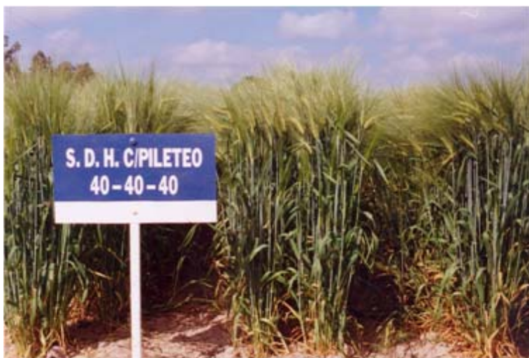
Figura 11. Comportamiento de la variedad Puebla, en siembra en surcos doble hilera con pileteo y fertilizante, bajo un temporal con 400 milímetros de lluvia.