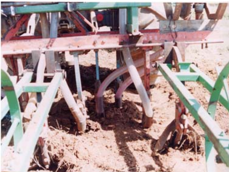
Figura 5. Distribución de la semilla y el fertilizante, en el sistema siembra en surcos a doble hilera.

Siembra en surcos a doble hilera con pileteo. Éste es el primer sistema de siembra que se sugiere utilizar en el cultivo de cebada maltera en condiciones de temporal y que rompe con la creencia del sistema tradicional al voleo. En este esquema de siembra la semilla se distribuye en hileras en el lomo del surco. Para su aplicación, se requiere de una máquina sembradora, que deposite la semilla de cebada en surcos a 76 centímetros de separación y en dos hileras sobre el lomo del surco (como si fuera frijol y maíz) a 20 centímetros de distancia ( Figura 5).