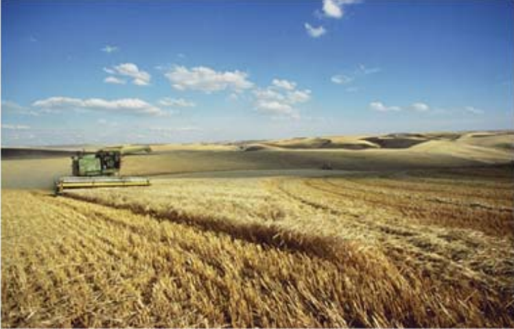
Figura 23. Cosecha o trilla de la cebada maltera de temporal.

semilla que no sea cebada; posteriormente, se debe calibrar la velocidad y la entrada de viento, para que no se quebré el grano y éste quede limpio de paja.