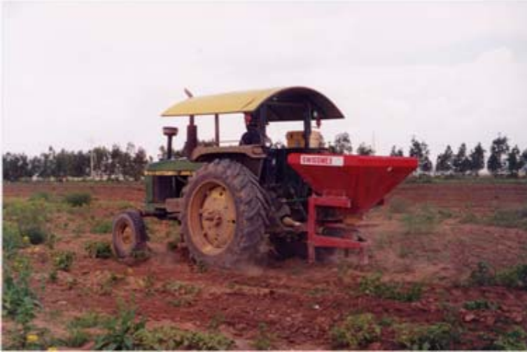
Figura 2. Máquina voleadora de cereales.