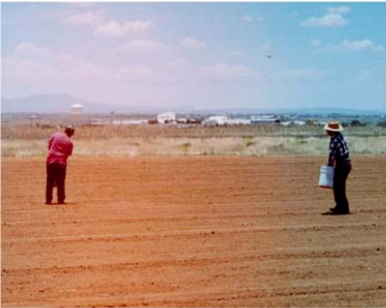
Figura 16. Calibración de semilla de la siembra tradicional al voleo.

Calibración de la siembra al voleo manual. Si la distribución de la semilla se realiza en forma manual (Figura 16), al igual que en la siembra con máquina voleadora, se requieren tirar los 13 kilogramos de semilla en los mil metros cuadrados; para una densidad de 130 kilogramos por hectárea de semilla, se debe cubrir también toda la superficie sin que queden áreas sin grano o con exceso.