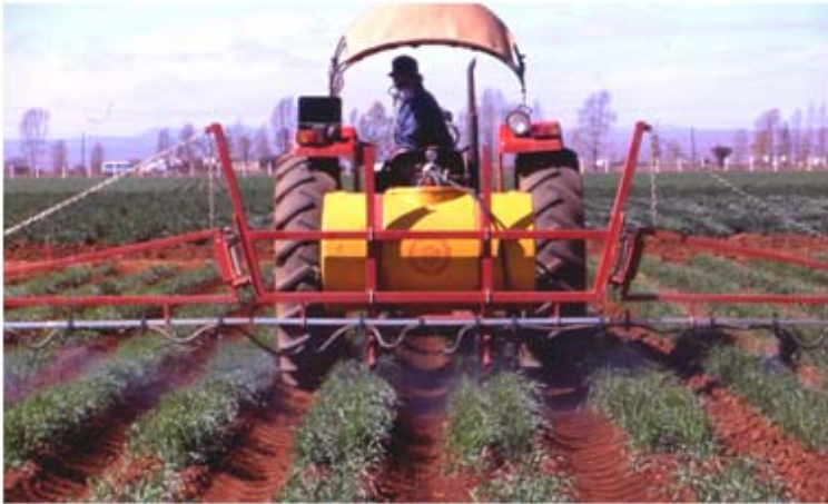
Figura 21. Aplicación de insecticida para el control de plagas.

Para el control del pulgón ruso , se puede aplicar Lannate 90 PS o Pirimor, en dosis de 250 a 300 gramos por hectárea, diluidos en 400 litros de agua; también, se puede aplicar Diazinón o Azodrín-5, en dosis de 0.750 a 1.0 litro por hectárea, diluido en 400 litros de agua (Figura 21).