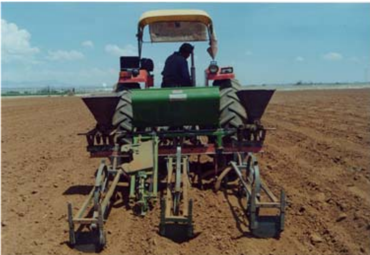
Figura 6. Sembradora, fertilizadora y pileteadora.

Para la formación de las piletas, se adicionan pileteadoras en los timones traseros de la sembradora; éstas al avanzar el tractor arrastran suelo del fondo del surco y con un levante cada 2.4 metros dejan el suelo, formando un bordo. Entre bordo y bordo forman las piletas, las cuales al presentarse las lluvias captan y retienen el agua (Figura 6).