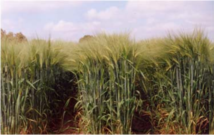
Figura 12. Variedad de cebada maltera Puebla.