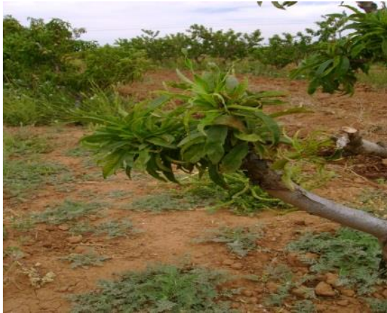
Figura 5. Proliferación de yemas en un punto de crecimiento