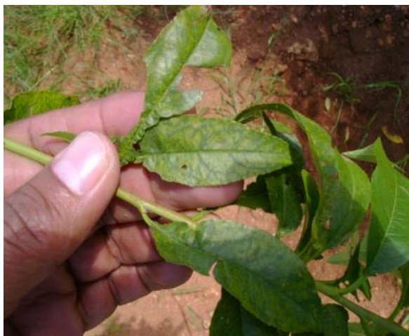
Figura 3. Hojas de durazno mostrando síntomas de mosaico de posible origen viral.

disminución de rendimiento, reducción en el diámetro del tronco y enanismo de plantas. La detección e identificación segura de este tipo de enfermedades debe llevarse a cabo por medios serológicos o moleculares