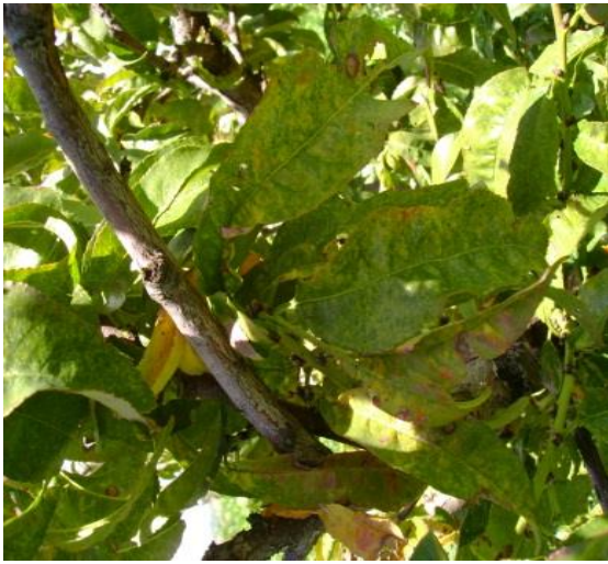
Figura 4. Hojas de durazno con sintomatología (moteado) de posible origen viral.