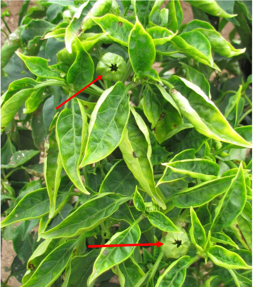
Figura 4. Planta de chile mostrando yemas grandes (flechas rojas), síntoma asociado con la infección por fitoplasmas.