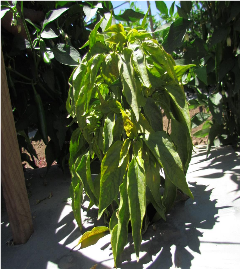
Figura 3. Planta de chile mostrando síntomas típicos de infección (enanismo, clorosis, pérdida de estructuras reproductivas, hojas elongadas) por curtovirus.