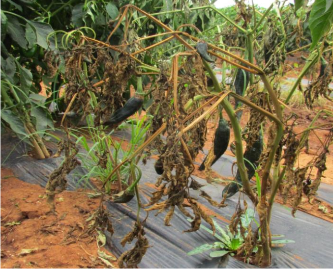
Figura 1. Planta de chile muerta por marchitez o secadera.