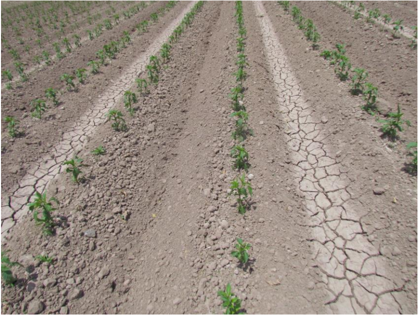
Figura 5. Parcela de chile mostrando buen manejo de agua de riego (riegos ligeros y terciados).