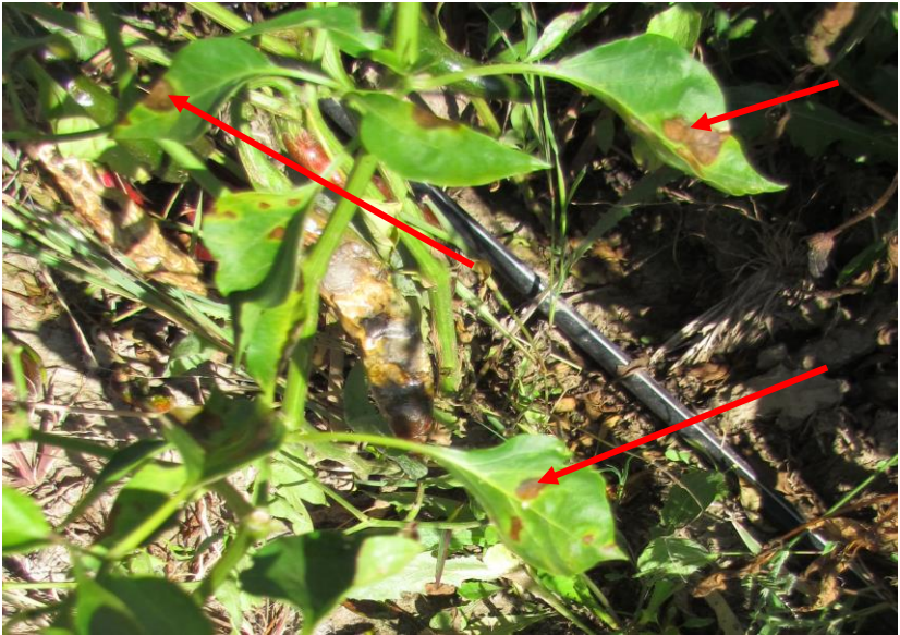
Figura 5. Lesiones de mancha bacteriana (flechas rojas) afectando las hojas de una planta de chile.

Esta enfermedad es causada por la bacteria Xanthomonas campestris pv. vesicatoria (Doidge) Dye; el patógeno puede sobrevivir en la semilla hasta por 16 meses aunque también puede hacerlo en el suelo, sobre restos no descompuestos de plantas infectadas, en plantas de chile voluntarias y en maleza en campo (Velásquez y Amador, 2009). Para causar una epidemia en las parcelas de chile la bacteria requiere de temperatura entre 24 y 30 °C, precipitación pluvial abundante y alta humedad relativa (Jones y Pernezny, 2003).