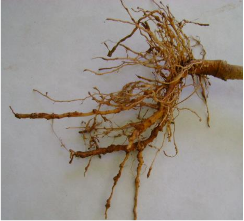
Figura 8. Raíz de una planta de chile mostrando agallas causadas por la infección por Meloidogyne spp.

Se han identificado especímenes pertenecientes a los géneros Aphelenchus spp., Aphelenchoides spp., Dorylaimus spp., Tylenchus spp., Pratylenchus spp., Hemicycliophora spp., Tylenchorhynchus spp., Helicotylenchus spp., Ditylenchus spp., Mononchus spp., y Rhabditis spp. en el suelo de parcelas comerciales de Chile en Aguascalientes, Chihuahua, Guanajuato y Zacatecas. No se han