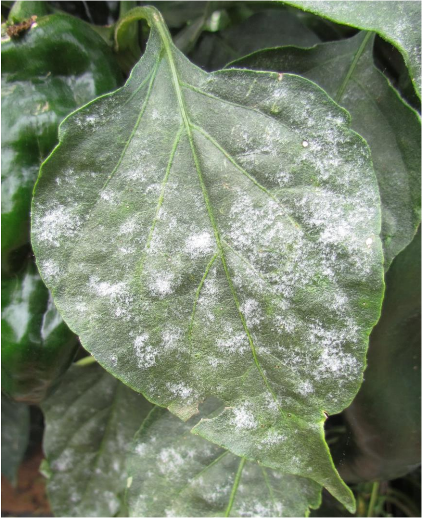
Figura 4. Hojas de una planta de chile mostrando lesiones (colonias) del responsable de la cenicienta polvorienta.