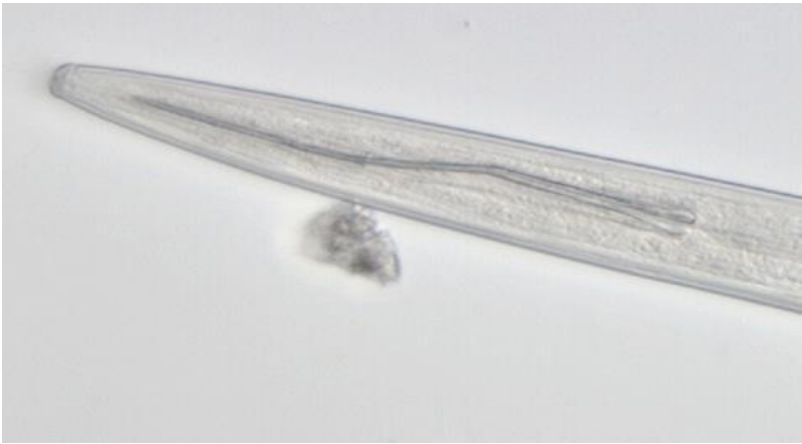
Figura 10. Porción anterior (cabeza) de un nematodo del género Xiphinema , vector del virus de la hoja de abanico.

rugosa (Téliz et al. , 1980). Sin embargo en los muestreos de suelo llevados a cabo recientemente en los viñedos del estado no se han encontrado poblaciones de este patógeno. Este último podría transmitir otra enfermedad viral denominada vena amarilla de la vid, hasta la fecha no detectada en la región.