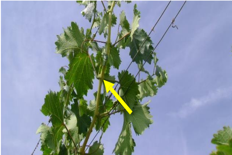
Figura 6. Sarmiento en desarrollo mostrando el síntoma de doble nudo (flecha amarilla).

Existe poca información acerca de la fasciación y desarrollo de sarmientos en zigzag (Figuras 7 y 8) en plantas afectadas por GFLV, sin embargo, se sabe que también puede presentarse con mayor frecuencia en un año y afectar más severamente a algunos cultivares (Hewitt y Gifford, 1956).