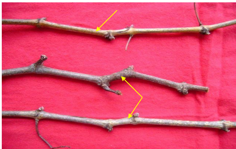
Figura 3. Sarmientos de vid en descanso mostrando el síntoma de entrenudos cortos (flechas amarillas).