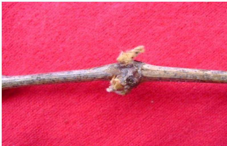
Figura 5. Sarmiento en descanso mostrando el síntoma de doble nudo.

Cuando dos nudos se presentan juntos y opuestos en un sarmiento se le ha denominado “doble nudo” y probablemente se trate de un caso extremo de entrenudo corto; el aspecto de este síntoma durante la estación de crecimiento es el de dos hojas opuestas en el mismo nudo (Figuras 5 y 6) (Hewitt y Gifford, 1956).