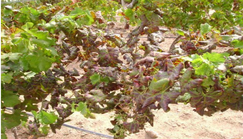
Figura 1. Parra mostrando síntoma de enrollamiento de la hoja (Bordes enrollados hacia abajo y coloración rojiza con nervaduras verdes).

(GLRaV-2) puede provocar la incompatibilidad de injertos (Monis, 2005).