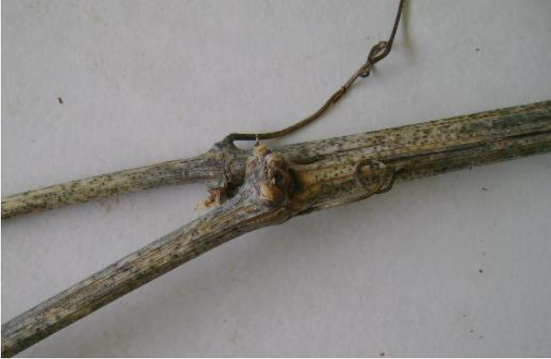
Figura 7. Sarmiento en descanso mostrando el síntoma de fasciación.