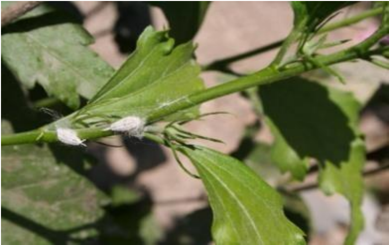
Figura 9. Adultos del piojo harinoso en ramas de la maleza conocida como amargosa ( Parthenium hysterophorus L.).

piojos harinosos (Figura 9) que pueden transportar algunos de los virus asociados con la enfermedad de plantas enfermas a plantas sanas (Cuadro 2). Es importante señalar que no se han encontrado infestaciones de esta plaga en los viñedos de Aguascalientes, pero es importante conocer los principales aspectos de su biología y manejo.