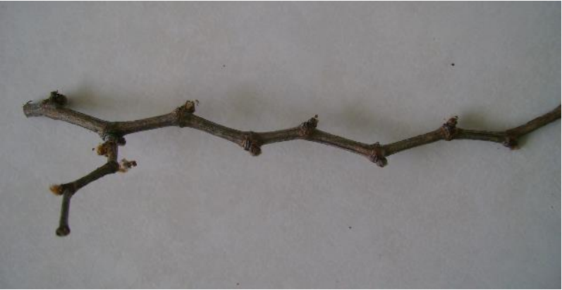
Figura 8. Sarmiento en descanso mostrando el síntoma de crecimiento en zigzag.