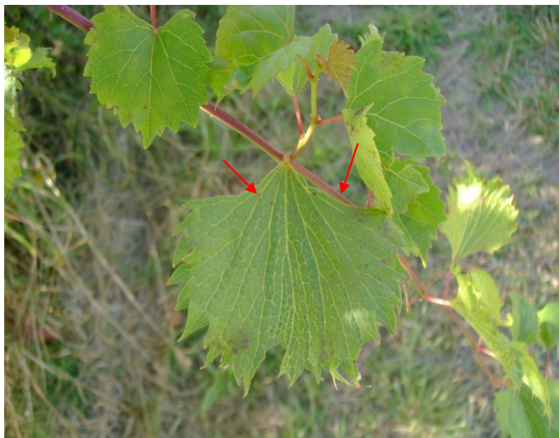
Figura 2. Hoja de vid mostrando falta de senos peciolares (flechas rojas), característica de la enfermedad conocida como hoja de abanico.

El síntoma de entrenudos cortos consiste en la presencia de una porción del sarmiento más corta que aquellas que le preceden o de los más jóvenes situados delante de esta porción dañada (Figuras 3 y 4). Aunque lo más común es encontrar solamente una de estas anomalías en los sarmientos afectados; ocasionalmente se pueden encontrar dos o más de estas anomalías en un solo sarmiento.