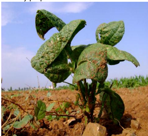
Figura 6. Planta de frijol infectada con BCTV mostrando acaparamiento, sin flores o vainas y follaje deforme.