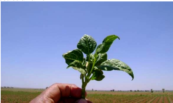
Figura 2. Planta de frijol mostrando achaparramiento, enchinamiento hacia debajo de las hojas y ampollado, síntomas característicos de enfermedades virales.