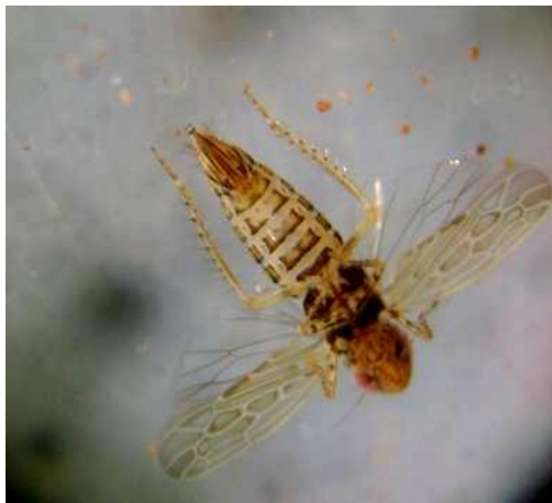
Figura 7. Adulto hembra de la chicharrita Circulifer tenellus Baker vector del BMCTV.