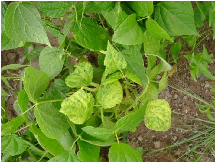
Figura 1. Planta de frijol mostrando hojas enchinadas y con mosaico amarillo.