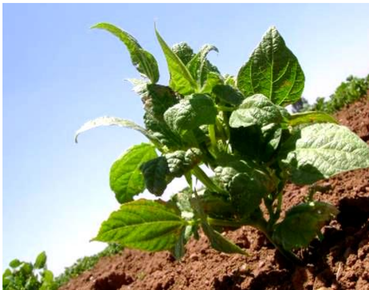
Figura 3. Planta de frijol con síntomas característicos de infección viral (achaparramiento, enrollamiento de hojas ampollamiento y nula carga de vainas).