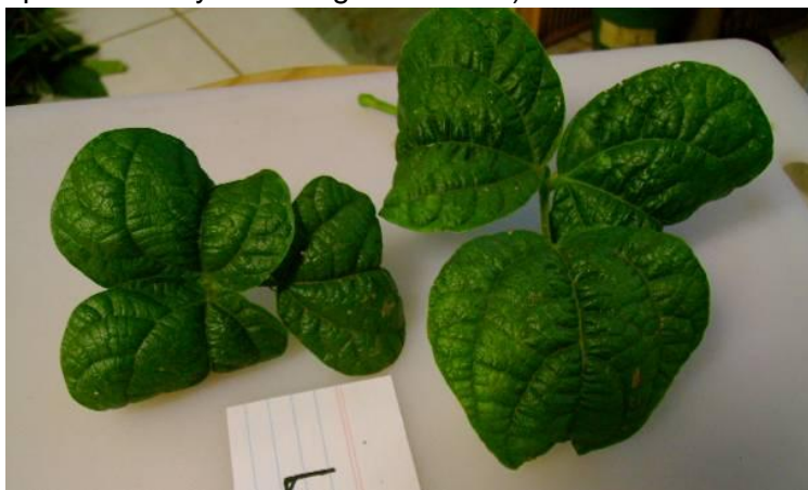
Figura 4. Hojas de frijol con síntomas de enchinamiento, típicos de las enfermedades provocadas por virus.