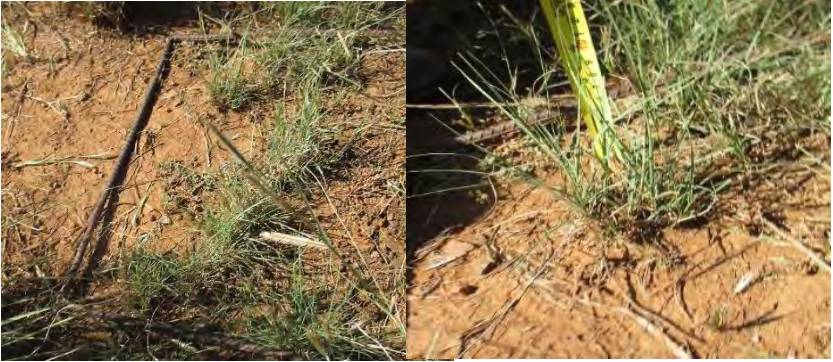
Figura 2. Muestreo de número y altura de plantas jóvenes de pasto Navajita.