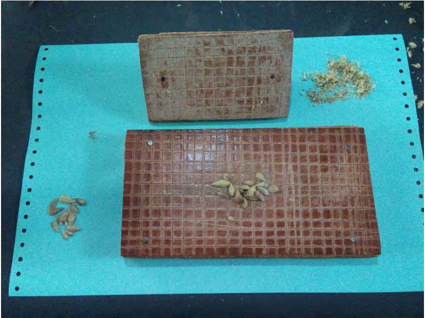
Figura 5. Escarificador manual de cariósides, el cual es un accesorio de madera y en su interior lleva forro de cuero o baqueta (Construido con información del Dr. Carlos A. García Díaz). Se observan espiguillas enteras, desgranadas y cariósides.