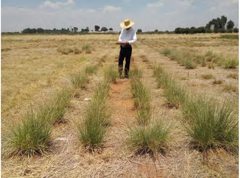
Figura 4. Accesión de pasto Zacatón alcalino Sporobolus airoides con follaje verde durante la época seca. 30 mayo 2016.

Kikuyo, con un 19.1, 14.0 y 12.2%, respectivamente (Cuadro 6).