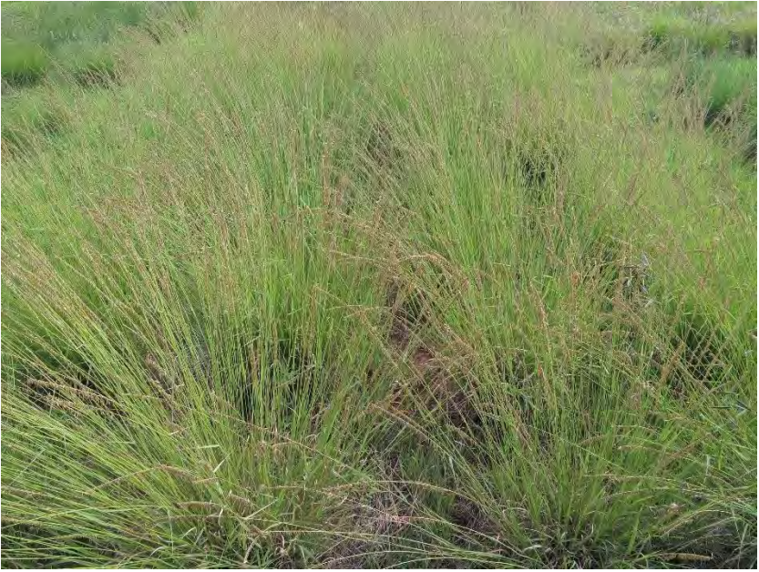
Figura 7. Pasto Banderilla cultivar Chih-75, en plena floración, en el Banco de Germoplasma de especies forrajeras del CEZAC-INIFAP.