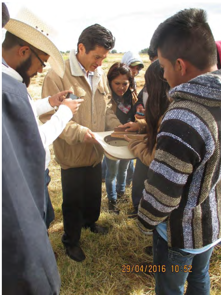
Figura 6. Prueba de campo para conocer de manera rápida, la cantidad de cariósides por fricción con extractor manual.