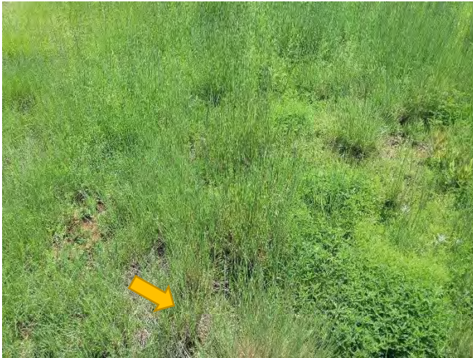
Figura 3. Plantas hijas de pasto Lobero Lycurus phleoides de la semilla que cayó al suelo, creciendo entre el callejón de parcelas.