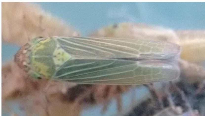
Figura 6. Vista dorsal de adultos del género Draeculacephala

praderas resultaron positivos a la bacteria Xylella fastidiosa (Daane et al. , 2011).