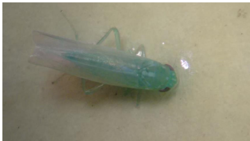
Figura 7. Vista dorsal de adultos de Empoasca