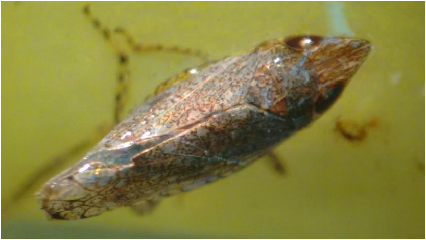
Figura 10. Vista dorsal de adultos de Scaphytopius spp.