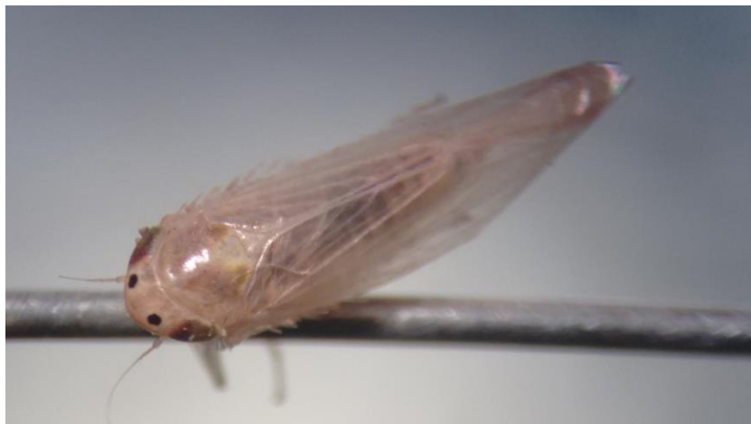
Figura 5. Vista dorsal de adultos de Dalbulus spp.