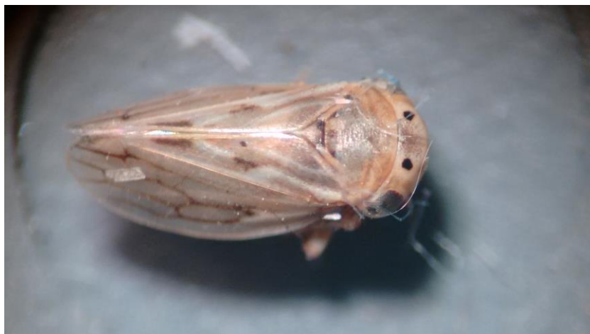
Figura 2. Vista dorsal de adultos de Aceratagallia spp.

Se capturaron en total 35 especímenes pertenecientes a éste género (Figura 2) en 20 localidades de Aguascalientes (25%) y Zacatecas (75%). El 54 y 46% de los especímenes capturados eran hembras y machos respectivamente (Cuadro 1). Las colectas de este insecto se obtuvieron en parcelas de alfalfa (63%), manchones de maleza (28%) y sitios con pasto seco (8%).