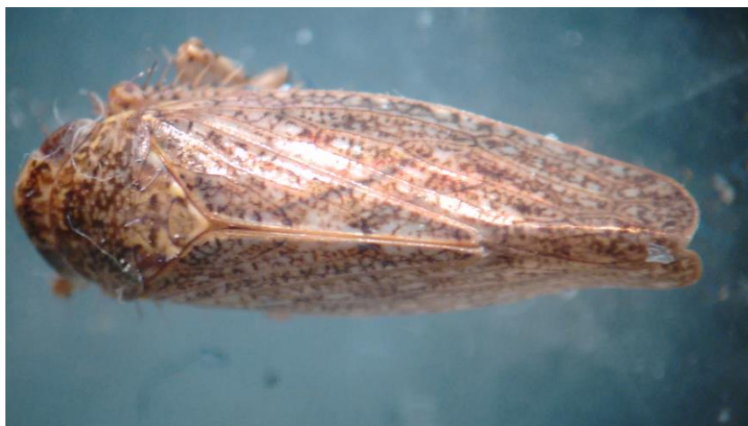
Figura 11. Vista dorsal de adultos de Texananus spp.