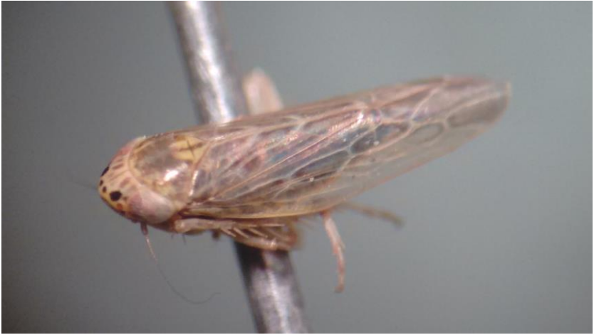
Figura 8. Vista dorsal de adultos de Graminella spp.

Nault y Madden (1988) han reportado distintas especies de Graminella como vectores del virus del enanismo clorótico del maíz ( Maize chlorotic dwarf virus : MCDV); por su parte Todd et al. (2010) señalan a G. nigrifrons (Forbes) como vector en modo persistente del virus del rayado fino del maíz ( Maize fine streak virus : MFSV); sin embargo el papel de éste género como vector de virus en Aguascalientes y Zacatecas no es plenamente conocido. Según Arocha-Rosete et al. (2011) G. nigrifrons es capaz de transmitir simultáneamente dos fitoplasmas pertenecientes a diferentes grupos (16Srl-W y 16SrVII-A) en frutales de los géneros Prunus y Pyrus . En 2014 se mencionó la presencia de fitoplasmas en cinco de 30 especímenes de