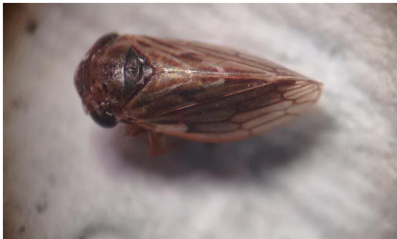
Figura 3. Vista dorsal de adultos de Agallia spp.