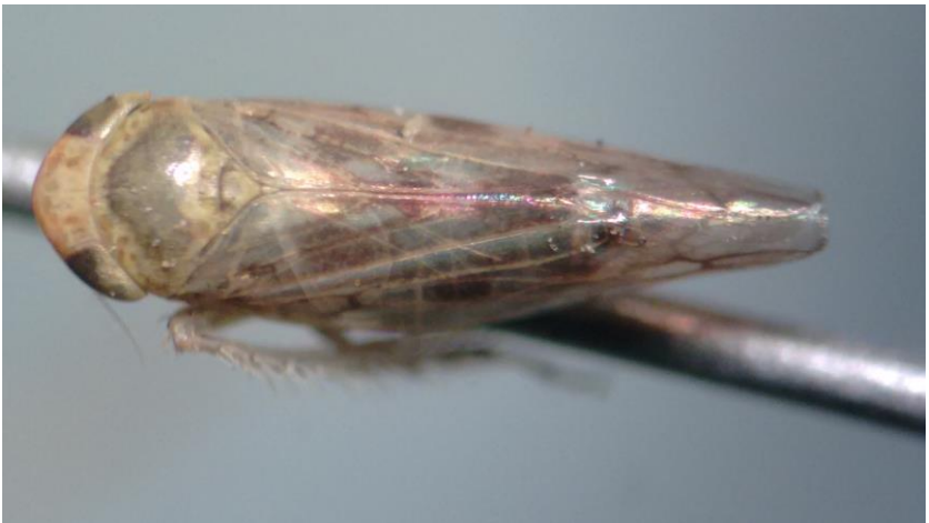
Figura 4. Vista dorsal de adultos de C. tenellus .

La presencia de adultos de C. tenellus (Figura 4), conocida como la chicharrita del betabel, durante el invierno en maleza de Aguascalientes y Zacatecas había sido mencionada por Velásquez-Valle et al. (2012); en el presente estudio se confirman esos resultados. Adultos de esta chicharrita se colectaron en 24 localidades, es decir en el 47% del total de sitios muestreados en el trabajo; del total de sitios positivos a la chicharrita del betabel, siete se encontraban en Aguascalientes y 17 en Zacatecas. La cubierta vegetal en los sitios positivos a C. tenellus estaba representada por maleza (75%), alfalfa (16.7%) y pastos y brócoli (4.2% en cada caso) (Cuadro 3).