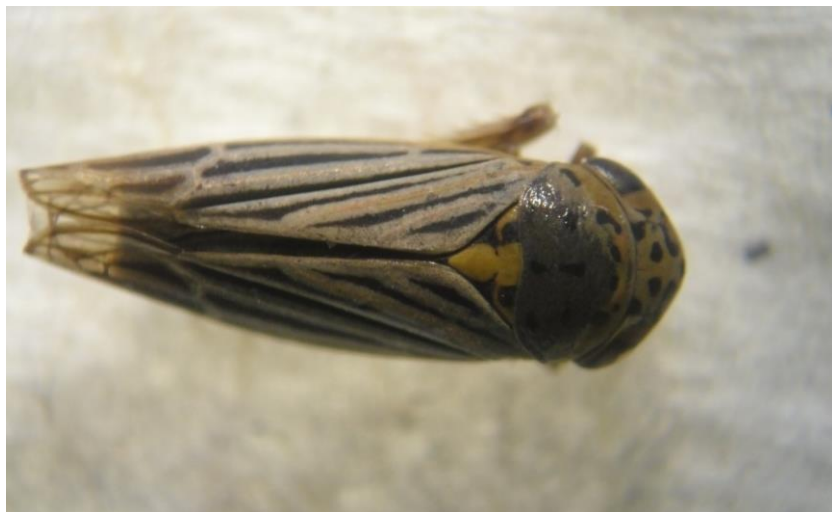
Figura 9. Vista dorsal de adultos de Hordnia spp.

Según Daugherty et al. (2009) y Janse y Obradovic (2010) se ha comprobado la transmisión de la bacteria Xylella fastidiosa por medio de las chicharritas Graphocephala atropunctata Signoret (= Hordnia circellata ) y G. versuta (Say) en California, EUA. De acuerdo con Senasica (2013), en la zona vitícola de Ensenada, Baja California también se ha encontrado a G. atropunctata y se le confiere su calidad de vector de X. fastidiosa , agente causal de la enfermedad de Pierce. Se desconoce el potencial de este género como vector de esa bacteria en el área productora de uva de Aguascalientes y Zacatecas.